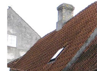
Skorsten med sokkel og krone samt tagvindue på 2 x 2 tagsten.