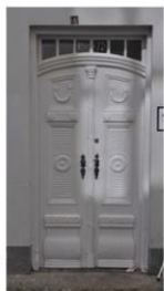
Klassicismisk dør i Strandgade 70.