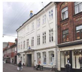
Den svenske konsulatsgård, Skydebaneselskabet, Stengade 46, er et klassicismisk hus med kvaderpudset underetage.

Klassicismiske huse kan tilføjes altaner på gårdfacaden efter bestemmelserne i § 7.11.