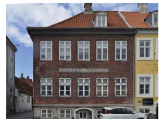
Ejendommen Stengade 79 med meanderdekoreret "løbende hund" i facaden.