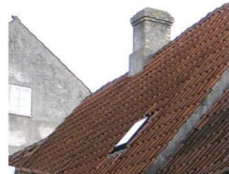
Skorsten med sokkel og krone samt tagvindue på 2 x 2 tagsten.