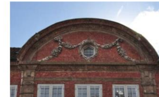
Dahls Gård, Stengade nr. 64: Facadens midterparti afsluttes af en fronton med guirlandedekorationer indrammet af en stor buet gesims. Husets markante og dramatiske facadedekoration er kendetegnende for barokken.