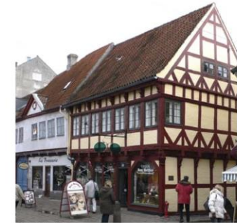
Middelalder- og renaissancehuse er opført med tage med hældning på ca. 50° til 60°. Renaissancehuset i bindingsværk i Stengade 20 har den karakteristiske høje tagrejsning.