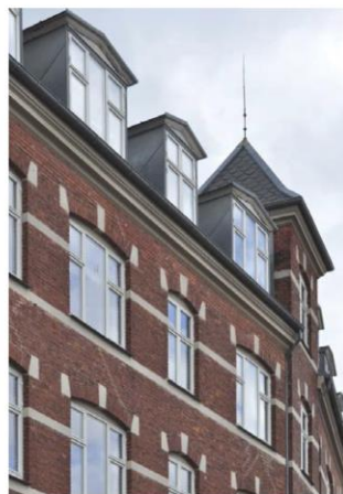
Svingelport hus, Stengade 8, det røde murværk med pudsede gennemgående facadebånd og detaljer omkring vinduerne. Hjørnet ud mod Stengade markeres med et tårn i taget.