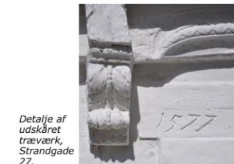
Detalje af udskåret træværk, Strandgade 27.