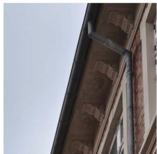
Gyldenstræde 5, detaljer i tagudhænget inspireret af klassisk italiensk arkitektur.