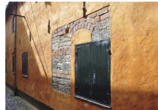
Oprindelig muredetalje friholdt i pudset facade i Gl. Færgestræde.