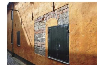
Oprindelig muredetalje friholdt i pudset facade i Gl. Færgestræde.