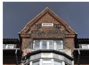
Strandborg, Strandgade 67, er et hus i historicistisk stil, hvor den afrundede karnap afsluttes opadtil i en gavlkvist med dekorativer i murværket.