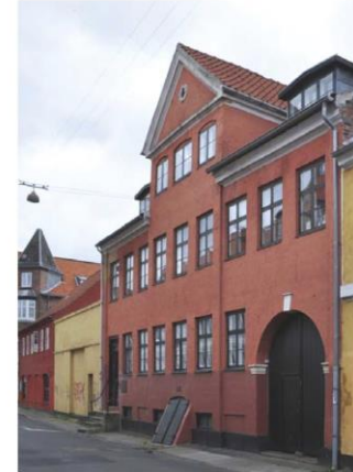
Strandgade 52 er et stort borgerhus fra rokokko-perioden, karakteristisk er den enkle facade med hvide gesimsbånd og den markante frontispice.

Barok- og rokokohuse kan tilføjes altaner på gårdfacaden efter bestemmelserne i § 7.11.