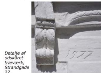
Detalje af udskåret træværk, Strandgade 27.