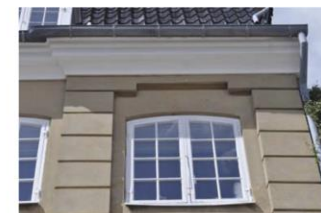
Muredetaljer omkring vindue i Von der Ostens Gård i Stengade 83. Her er ørelisener langs siderne og en bred gesims under tagudhængen.